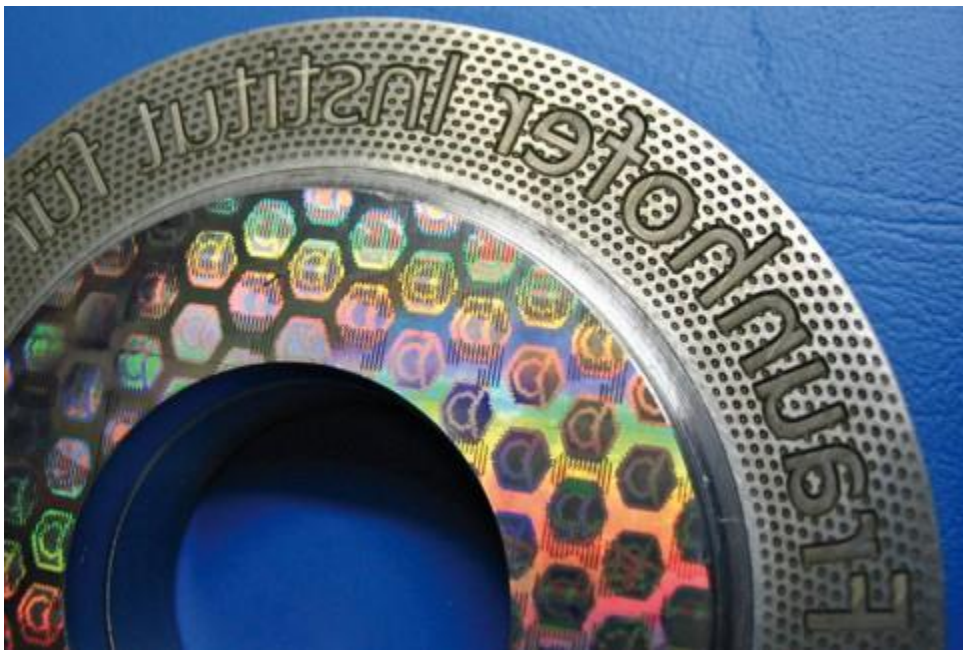
Produktpiraterie verursacht weltweit Schäden in Milliardenhöhe: Eine Kombination von sichtbaren und unsichtbaren Strukturen schützt wirkungsvoll vor Fälschungen. Mit Sprengprägen wird das auf wirtschaftliche Weise möglich auch für Massenware.